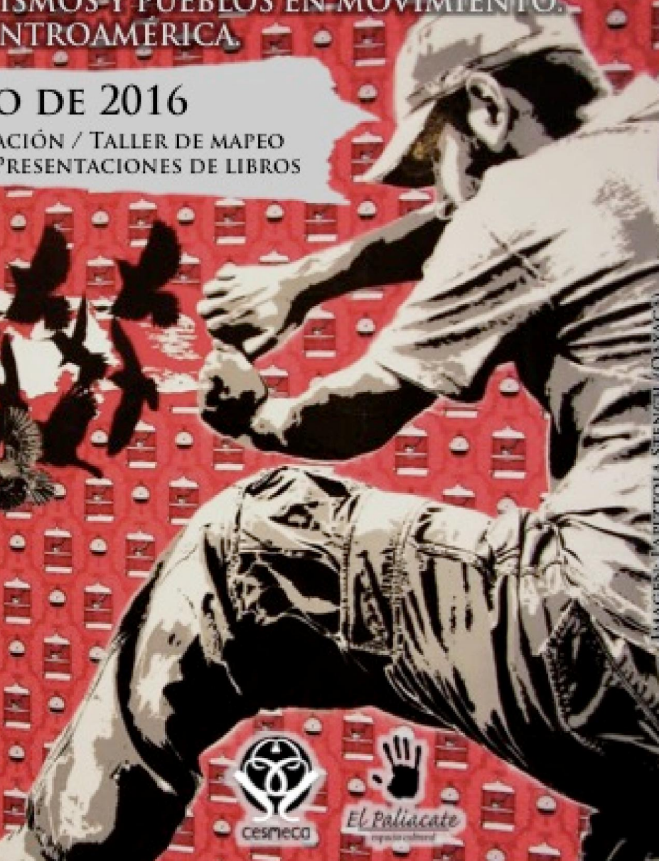
IMAGEN: LA TIZTOLA STENCIL (OAXACA)